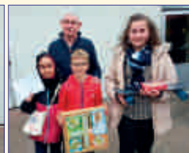
Nos 3 petits gagnants avec le Président