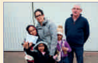
La famille gagnante du gros lot avec notre Président