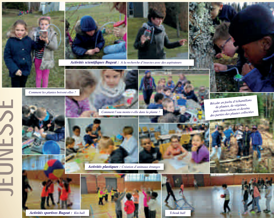
Activités scientifiques Bugeat : A la recherche d'insectes avec des aspirateurs

Après 3 jours bien chargés, ils sont rentrés avec beaucoup de choses à raconter.