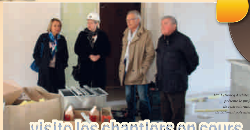
M me Lefrancq Architecte présente le projet de reconstruction du bâtiment polyvalent